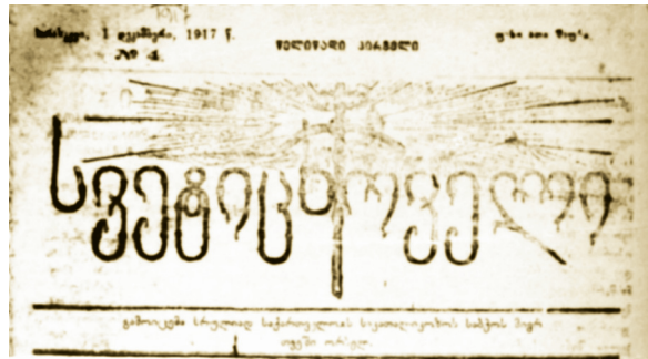
ჟურნალ „სვეტიცხოველის“, 1917 წლის 1 დეკემბრის, ყდის ფრაგმენტი