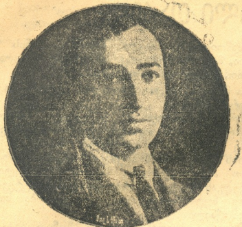
პ ა პ ა რ ი.

პაპარე (პაიკ პეტროსიანი) დაიბადა 1895 წ. 2 თებ. ახალ ბაიაზეთის ერთი გლეხის ოჯახში. საშუალო განათლება მიიღო ტუ. სომეხთა ნერსესიანის სკოლაში. მწერლობას დაეწაფა ბავშობიდანვე. სამწერლო ასპარეზზე გამოვიდა 1912 წ. ექიმ გ. ჩეიზიანის ყოველკ. ჟურ. „სინათლე“-ში ლექსებით. შემდეგ ლექსებს ვერა და სწერდა პატარა მოთხრობებს, ბოლოს რეცეპიენტს, კრიტიკულ შენიშვნებს და სხ. თანამშრომლობდა ყოველ სომხურ ჟურნალ-გაზეთში. მისი ნაწერების შინაარსია სოფლის ყოფა-ცხოვრება. დაწერილი აქვს პიესებიც: „ზემოსართული“ დრ. 3 მოქ., „სატის მონა“ დრ. 3 მოქ., „გიულიზარ“-მუსიკ. დრ. 5 მოქ. (მუსიკა დასწერა სომეხ. ახალგაზრდა მუსიკ. ე. ტალიანმა), „საერთო კრება“, ვოდ. 1 მოქ. ყველა ეს ხშირად იდგმევა სომხურ სცენებზე, უმთავრესად უკანასკნელი, რომელიც თითქმის ხალხურ ანდაზად გარდაიქცა.