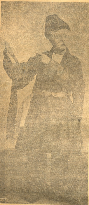
მ. ნ. ხაჩატრიანი.