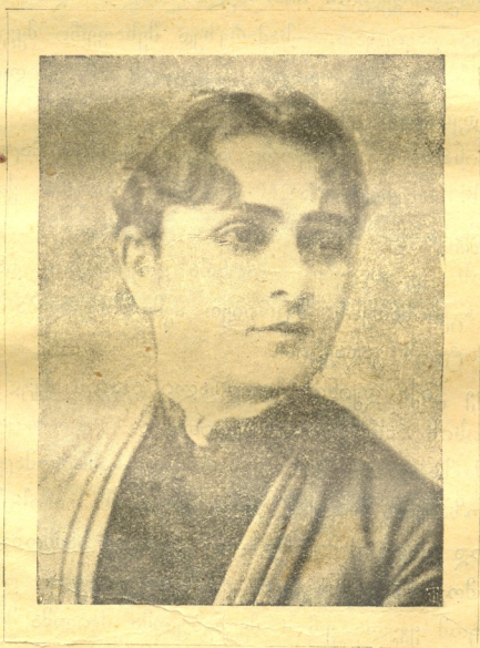
მარია მის. საფ.-აბაშიძისა მცოვანი მსახიობელი, მისი ავადმყოფობის გამო.