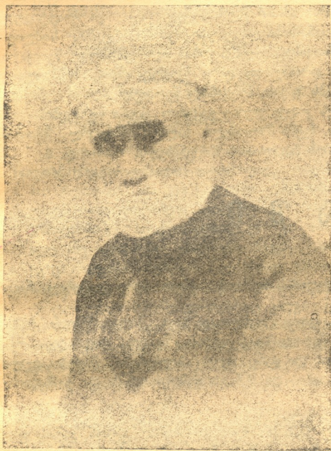
ილიას წინამძღვარი - შვილი.

(18—1981) ცნობილი საზოგადო მოღვაწე, საქართველოში პირველი სასოფლო-სამეურნეო წინამძღვარიანი კარისა სკოლის შემქნელი.