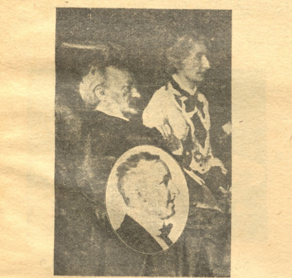
ვაგნერი, მეუღლე მისი—კოზიმა და შვილი ზიგფრიდი.

(წერილი გერმანიიდან, საკუთარი კორესპონდენტისაგან)