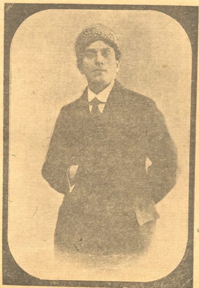
მანო სარაჯიოვილი (1880—1924)