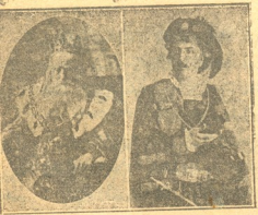
მეფე ლირი ჰამლეტი

№ 43 - 1916 წელ. მართხმ კვირა, 23 ღვინობის. ზამთრდამიანი 12 კ