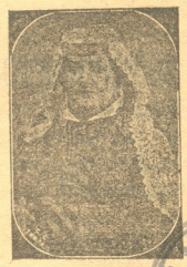
სალომე ზეჟენისა გურგენიძისა ზვი ქელოქიძე, რომლის მთელი თავისი ქონება-ფულს, მ მულეტი, ვენახები და ტყე კა- რთულ გიმნაზიას უანდერბა და- კრძალეს მარიაპოლისთვის 41 ხოჯიგანკის სასაფლაოზე.