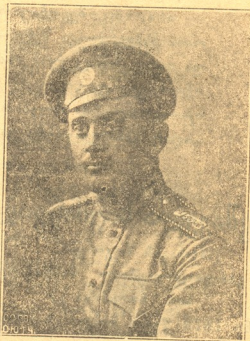
პრაპ. მერაბ სოლ. ანდრონიკაშვილი † ოსმალეთის საზღვარზე.

* * * სქენება ყვავილი ვარდისა, თაფრაქ-ნდრული, მტირალი, ბულბულის ბაღილდ რომ ყვავი დასჩხავის ოხერ-ტიალი თუქუნა წვიმის ნაცლადა ენთხევა შხაპის ფილისი..