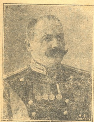
თავ. კ. ნ. აფხაზი აღმოსავლეთ საქართველოს თა- ვალაზნაურთა წინამძღოლად ახა- ლად არჩეული.