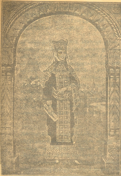
თამარ მეფე (1184—1213)