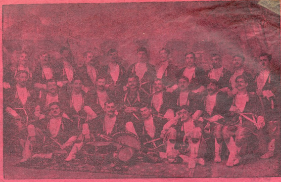
მის. კახაძის გუნდი.