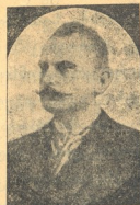
ლ. გ. ლომშა

მეორე ბევრზე-ბევრი! სვეტი-ცხოვლის ტაძარში ტევა არ იყო და გალავანშიაც იმდენი ხალხი იღვა, რომ განძრევაც არ შეიძლებოდა. დიდის ამბით და დიდებით დაასაფლავეს მეფე.