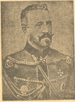
მ. ი. უ. ნიკოლოზ ნიკოლოზის-ამ მეთის ნაცვალი და კავკასიის ჯართა მთავარსარდალი, თბილისის ჩამოხპანდა მშენებლისთვის.

დღესაც ეს თეატრი პირნათლად ემსახურება თავის მიზანს, მაგრამ ვინ არ იცის,