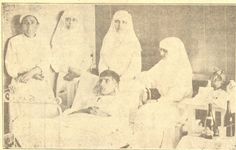
ავადმყოფი მკოსანი ვაჟაფშაველა წმ. ნინოს ქართველთა ლაზარეთში და მისი მომვლელი მოწესალებების დანი.