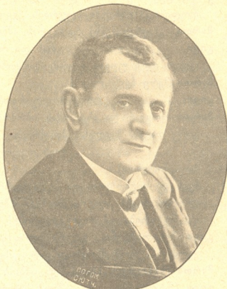
უკანასკნელი სურათი 1915 წ. გადაღებული