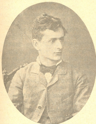
სიჭაბუკიის სურათი, 1879 წ. გადაღებული.