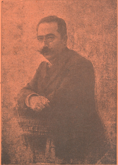
† კოტე მესხი

გარდაცვალების წლის თავი სრულდება პარსკევს, 15 მაისს. შაბათს—16 მაისს ქაშვეთის ეკლესიაში გადახდილ იქნება პანაშვილი.