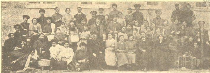
სასოფლო სკოლის მასწავლებელნი გორის საკონსერვო კურსებზე. რომელთაც ორი თვის კურსი დაასრულეს 7 მარტს და სოფლებში წავიდნენ-წამოვიდნენ ამ კოლ- ნის გასაგრძელებლად

შედიხართ თეატრის დარბაზში და ისიც იქ გხვდებით. ვინ იცის როგორ ან რა გზით შეიპარა შიგ, წამოსკუპულა ქანდარაზე და ტაშის ცემით გიზშობს სმენას. მან იცის ყოველი კუთხე, ყოველი უბანი. ყველ.სა სცნობს, იცის ვის უნდა სთხოვოს, ვინ უნდა გააჯავროს, ვისი უნდა ეკრძალებოდეს. თავანწირული ებრძვის სიცივეს, სიმშოლს, მაგრამ ერთი წუთითაც არ ეძლევა სასოწარ-კვეთილებას, მე კი მუდამ მდუმარე, მწარე დიქტირებით გარემოცული დავდივარ ობლად და როდესაც შევითხებინა: რაღა ხარ მოწყენილიო, ჰასუსხის მიცემასაც ვერ ვახერხებ. ქუჩის შეიღმა იცის საღ რა უნდა სთქვას.