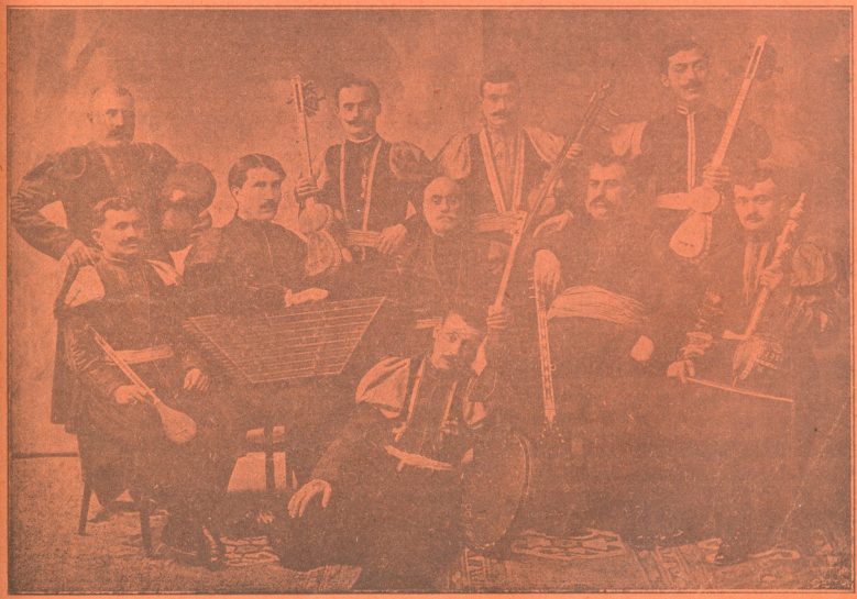
ჰაზირას კუილეზის დასტა

დღეს კონცერტსა ჰმართავს „არტ. სახ. თეატრის“ დარბაზში.