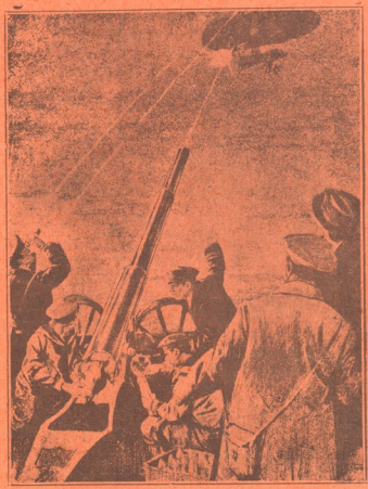
თანამედროვე ომის ერთი სურათთაგანი (იხ. ამავე ნომერში გვ. 7)