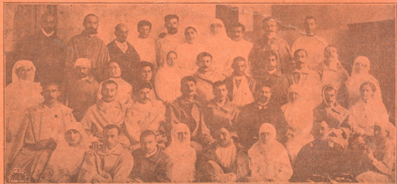
დაქრ. ქართველ მეომარნი და მათი მომველენი წმ. ნინოს ლაზარეთში