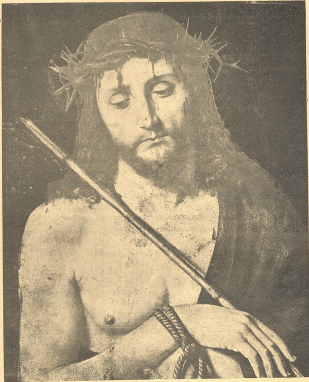
იესო ქრისტე ეკლის გვირგვინით