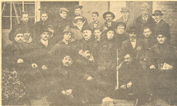
საბურთალოს სახალხო თეატრის სცენის მოყვარენი (წარმოდგენები დაიწყეს 15 თებერვალს)