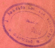
აშული მანირა თავისი დასტით

(მისი „0 წ. სააშულო მოღვაწეობის შესრულების გამო)