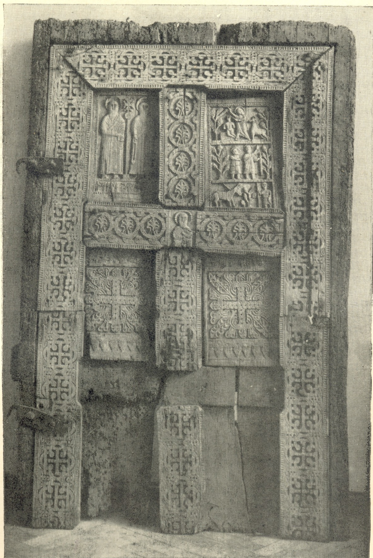
ლაშეს ვანის ღვთისმშობლის ეკლესიის კარი