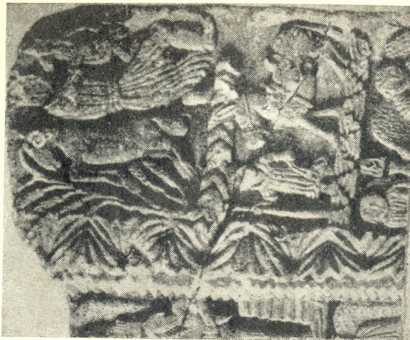
წებელდის კანკელის დეტალი