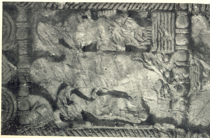
ბულდაძის სტელის მსხვერპლ შეწირვა