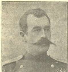
ქ. შ. ა.