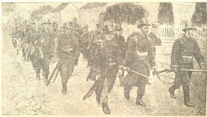
ბელგეიელი ჯარის კაცნი

აი თუ გნებავთ ელისსონი. ბავშვამც კი იცის იგი, მაზედ მოუზნობს კაცი და ქალი, თაყვანისცემით წარმოითქმის მისი სახელი. მთელ ქვეყანას მოედო მისი საქციელი. თუ როგორ უნდოდა ელისსონს წიწილები გამოეჩინა. ჯერ კიდევ ხუთის წლის ყრმა—გარდმოქცემს მისი შემთავანე.—დაფიქრა იმ გარემოებამ რომ კვერცხებიდან, რომელიც მას არა ერთი გაუტეხია და შიგ კილისა და გულის მეტი არა უნახავს რა, წიწილები გამოიღიან. შინაურებმა ბევრნაირად აუხსნეს ბავშვსა, თუ როგორ გამოჰყავს ქათამს ჩა-