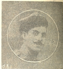
პოლკ თ. ი. თუმანიშვილი

გვიწვევით, გვიწვევით, ვკვდებით უპატრონოდ... სადა ხარ შენ ღმერ- თო, შემქმნელო ცისა და ქვეყნი- საო!.. ყოვლად ძლიერო დასაბამო კეთილისა და კაცთმოყვარე! რად სდუმხარ, რად არ მოველინები ტან- ჯული მწე-მფარველად: ესენი ზომ შენი სახელით და შენივე წაქეზებით ეკვეთენ ბოროტებას, რათა გან- მტკიცებულიყო მუფუფა კეთილისა . სიმთა ჯგუფი ჰანგსა სცვლის და სრულ პიანისსიმოზე გადადის, ვიოლონჩელი ხსნის მოტივს იწყებს. პირველი ვიოლინოს ზევითა ფარ-