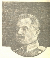
ფლ.-ად. თ. გ. ნ. ერისთავი