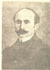
გან. მწერ. როსტანი

სიხარულის ნიაგი აღარ ჰქრის, ყველგან სიჩუმეა, ყველგან გოდება შემოდგომის დღე დიდვრემილია.. მინდორში აღარ ისმის ხმა მშრომელისა. საღამოს ჟამს, ქობ-მახებიდან მხოლოდ მწარე ქვინი მიისმის.