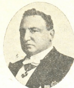
ა. ი. სუმბათა- შვილი-იუჟინი

ალექსანდრე სუმბათაშვილი- იუჟინი, ჩვენი თანამემამულე, ცენტრალური ფიგურაა რუსე- თის სოციალურ სელაფენებაში. მრავალი წლები მოღვაწეობისა და ამასთან მრავალჯერ დატრ- ეში, როგორც მსახიობის, რე- ჟისორის და დრამატურგის, ცხადია შეხვედრული ღრმად და უტყუარ ნაჭთან, საუკეთესო სტრატეგობა რუსულ თეატრას მატანეში. აღ. სუმბათაშვილი-იუჟინი მთავარი სელმძღვ- ნეღია მოსკოვის სიმეორატორთ თეატრი სა. ეს თეატრი თავგამოდებით იცავს რე- სულ თეატრის ტრადიციებს, — ამ შემთხვევაში კლასიციზმს. ჩვენ აქ მისი რთული ჰიროფენების დახსნათებას არ ვნდაილობთ, ამას შემდეგ წე- რღაში ვუნდებით, მხოლოდ ამჟამად გვინდა კალ- მის მოხსნათ დაფხატოთ სიდეუტი მისი, რო- გორც ქართველის და სოთეატრო მოღვაწის, რანაირდაც ჩვენ ეს გვეჩვენა მასთან ორჯერ საუბრის დროს.