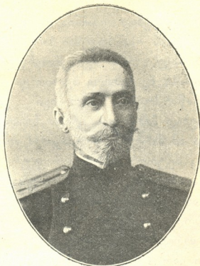
დ. კელდია შვილი