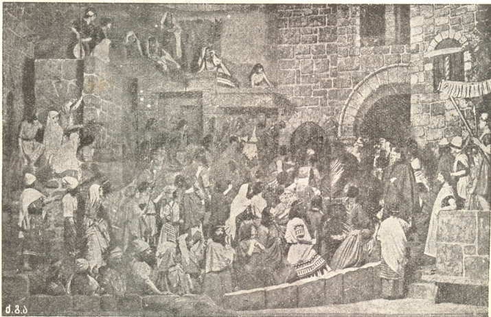
მ. შ. ბ.

სცენა საესეა ხალხითა. ბევრს ბზისა და ზეთის-ხილის შტოები და ყვავილები უჭერია ხელში. გზა, რომ