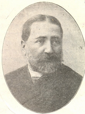
ილია ჭავჭავაძე (1837—1907)

მესამოცე წლების მოღვაწეობა შექმნიეს სახელი ხანა საქართველოს ცნაურებაში. ამათ გამოაცხადეს დაურადებლად ეროვნული შროგარმა. მამუკმა იტ-