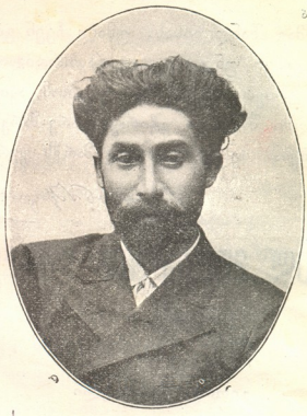
ი. ვალოვსკილი განკურნების გამო