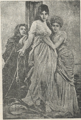
რწმენა, იმედი და სიყვარული