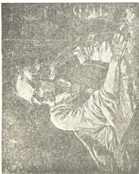
კ ბ რ ი უ ა ბ ბ