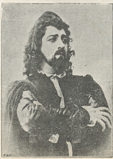
ვლ. ალ.-მესხიშვილი ურთელ-ავოსტას რილში დღევანდელი ბენეფისის გამო