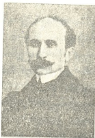
საფრანგეთის გამოჩენილი დრამატურგი ე. როსტანი მისი ახალი პიესის „შანტეკლერ“-ს გამო

ე. როსტანის ახალი პიესა „შანტეკლერ“-ი მოახლოვდა ე. როსტანის ახალი პიესის „შანტეკლერ“-ის სცენაზე დადგმის ხანა, და