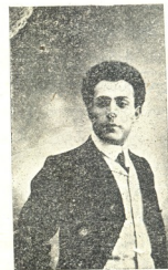
სომეხთა ხსელგაზდა მსახიობი სევეშიანი