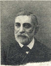
თ. გიორგი მიხეილის ძე თუმანიშვილი ქართ. სამუდამო სცენის ერთი დამფუძნებელთაგანი, დიდი ღვაწლი მიუძღვის ჩვენის სცენის წინაშე.