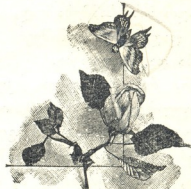
მ ს ა ხ ი ო მ ს