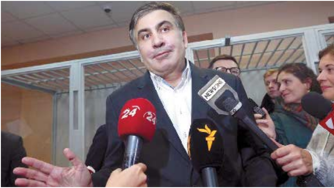
ნაცებო და ნაცების მხარდამჭერებო, სულ ტყუილად გიხარიათ, რაც გიხარიათ და ბედნიერებისგან ფრთაშესხმული სულ ტყუილად უვლით დავლურს. ერთადერთი, რაც მართლა უნდა გიხაროდეთ ისაა, რომ თქვენი გაბანძობული ბელადისთვის „პერედაჩების“ ზიდვა უკრაინაში არ მოგიწევთ და აქვე, „მატროსოვის“ ციხეში, მიუცუნცულეობთ ხოლმე. აი, ეს გაგრძელება და ფინალი აქვს მოსამართლე სოკოლის განაჩენს. თქვენ კი ვერაფერს მიმხვდარხართ და გიხარიათ... გიხარიათ და გიხაროდეთ, აი, დარდი...

პროშენკოს, ალბათ, ჭორად კი ჰქონდა გაგონილი, რომ სააკაშვილი ალაგ-ალაგ ცოტას ურიკინებ-