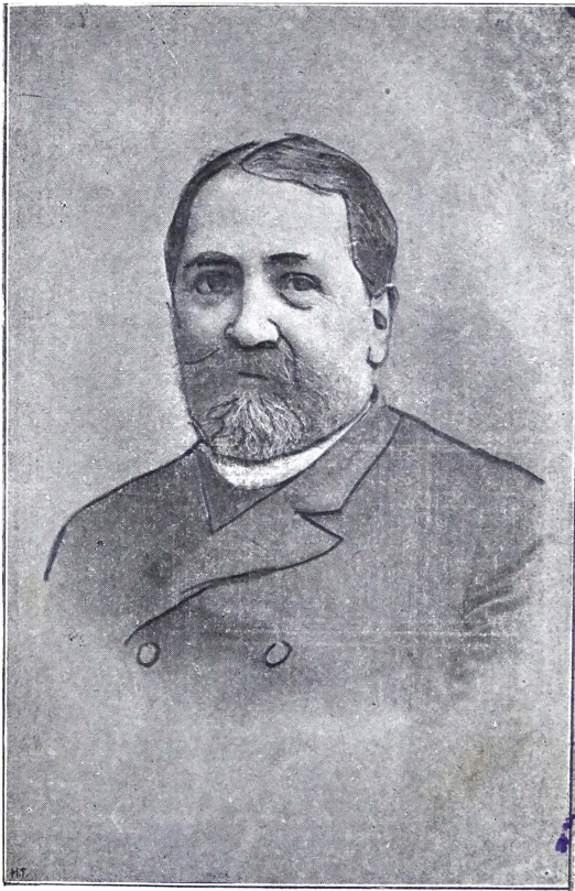
ილია გ ჩავჭავჭავაძე.