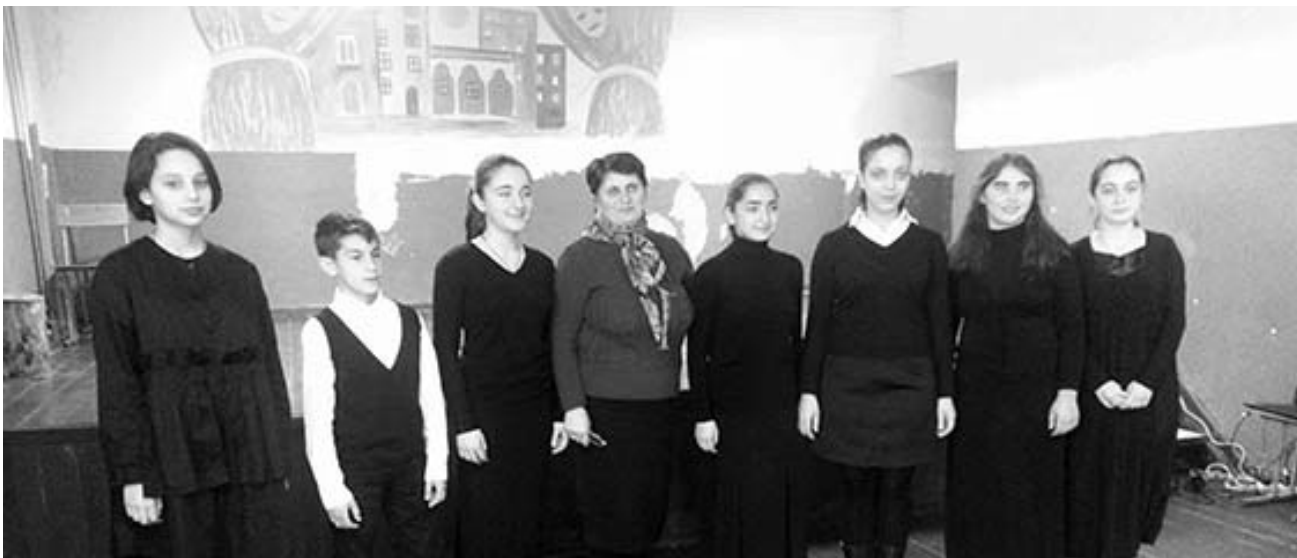
№219 საჯარო სკოლის ქართული ენისა და ლიტერატურის კათედრა

საღამო დასრულდა ოპტიმისტური ფრაზებით: „და ილიაც არ მომკვდარა, მამულისთვის რჩება ლამპრად!“