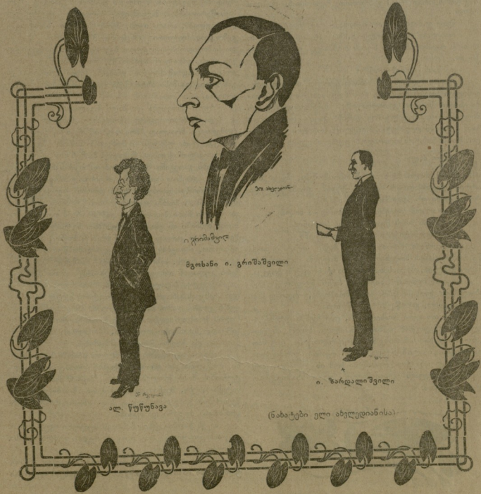
მ. ჯორჯიანი მ. ჯორჯიანი