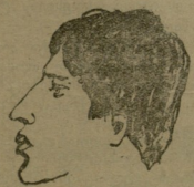
პოეტი ტვიან ტაბიძე