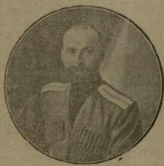
გენერალი კვინიტაძე საქართველოს ჯარების მთავარსარდალი