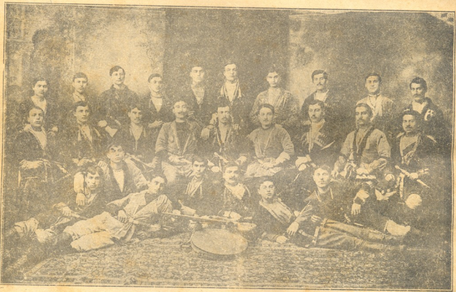
ალ. მასხურაძის ქართულ მომღერალთა გუნდი