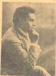
ბ. ი. ზალობსკი

ის აღარ არის. ის აღარა გვეყავს — ვინც ქვეყნად იყო ღმერთთა სიმბოლოდ, ის აღარა გვეყავს და იმის საფლავს — დამკურანი ვერა ამშვენებს მხოლოდ. ...და აღარა გვეყავს. მოჰკვლა წყვილიაღზე. ერთ ტანჯული კვლავ ცრემლად ღნება. მაგრამ მოვა დრო და განთიადზე — ის სამშობლოსთან მკედრებით აღსდგება! ილ. მოსაშვილი