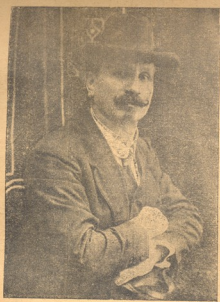
ე. გ. ბროფი პრეფ. სიმღერის თბ. კონსერ. ახლო ხანში სახემ თეატრში გაიმართ. მისი ჰანუ. სამუსიკო მოღვაწე. დღესასწაული. დაიდ- გება ოპ. რიგოლეტო. შვასრ. რიგოლეტოს