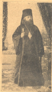
ლენინდე კათალიკოს-პატრიარქი მცხეთაში ეკრთხეული თებერვლის 23.