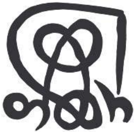
თამარ მეფის ხელრთვა (ფაქსიმილე)

განადიდოს ღმერთმან დიდება მისი განაგრძოს ჩრდილი მისი და განამტკიცოს კეთილდღეობა მისი