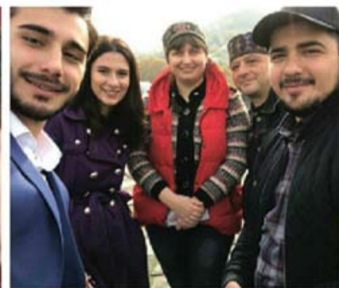
1. Съёмочная группа клипа 2-3. Во время интервью