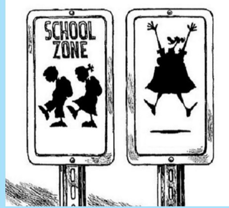
თავმოყვარეობა – ღირსებისა და არა მონური ქედმოხრის გრძნობა კარგი საქონელია, ღმერთმანი!

უსაქმურები ხართო, ღვინის ყლაპვის მეტი არაფერი იცითო, ორსული ქალივით უშველებელი ღიმი გადგათო. ამ საუკუნეში კი თურქმა მწერალმა ორჰან ფაშუქიმ ნობელის პრემია მიიღო. სტუმართმოყვარეობის მოტივით (უფრო, ღრმად თუ ჩავწვდებით განაზრახს, სხვა მოტივითაც) გადაირიგნენ ახალგაზრდა ქართველი მწერლები, ჩამოიყვანეს, „პრეზენტაცია“ მოუწყვეს, „სუფრადანციაც“ ზედ მიაყოლეს. ერთმა მწერალმა ჰკითხა „უძვირფასეს, სტუმარს, რუსთაველის „ვეფხისტყაოსანზე“ რას გვეტყვიო? – არც კი მაქვს ნაკითხულიო (!?) ახლახან ევროვიზალიბერალიზაციაზეც ხომ არ მოგეძალათ ბევრს „ხბოს აღტაცება“?