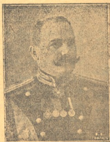
თავ. კ. ნ. ახუნაში აფერი იმერეთის თავდაზნაურთა წინამძღლონი, რომელთაც საზოგადო ქონება ეროვნულ ყრილობას გადასცეს