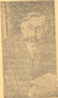
ემილ ვერჰარნი, ბელგეთის სახელგანთქმული მწერალი. გარდაცვალებიდან ერთი წლის შესრულების გამო.

რად, რომ დღეს თავს ვეღარც კი ახწევს და უშეს კვიბადებს: ვათუ ხალხური სიძლეობა ევრუბიუდად ეკადანათლენ და ამით ზრინციბს ურთულ ბრძოლისს უდალატონ! მარამ ეს მომავლის საკითხია. დაუბრუნდეთ ჩვენი წერაღის სატანს. დრო-ჟამი ზნეობრივად უფლებას შობს დამიანთა ურთიერთ ცნობებს. ჩვენი ისტორიული ტერატორია გაცილებით მეტია, რაც დღეს სინამდვილეს შეადგენს მარამ დღეს მის საყვებით ვერა ვფლობთ. ეს დრო-ჟამის ბრალაა. ზღათ-წესები ბურთა უცხო ურისა გატყინა, მარამ ჩვენ მისთვის ვიბრძვით, მის ჩვენად ვთვლით. ესეც დრო-ჟამის ბრალაა. ასევე ითქმის აღმოსავლეთურ კემოყნებაზეც ის ჩვენც უნდა გემოყნადეს, რადგან მათი სტრუქტურა ჩვენი წინაშე მრავალ ჟამთა განმავლობაში, მიტომ ჩვენი ფსიხიის რამდენიმე ჩამოყვლიბებელია, მამსადამე მის დამტყვლიბ... მუშა მის. დეკამე