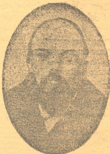
ნიკოლოზ ლენინი—უდიანოვი მეუმბავლესეთა ბილ შევიკ—სოციოლდემოკრატი ბელადი, რომელიც ამ წამთ პეტროგრადის აჯანყებანს სათავეში უდგას.