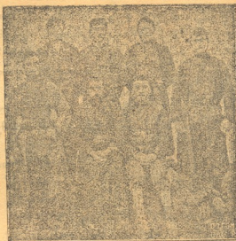
ხაშმელ მომღერალ-მგალობელთა გუნდი. გიორგი ეპიტაშვილის ლობთარობით.