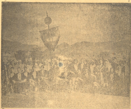
ქართული მრევლ-დემოკრატიული ასამბლეა მსხატავი