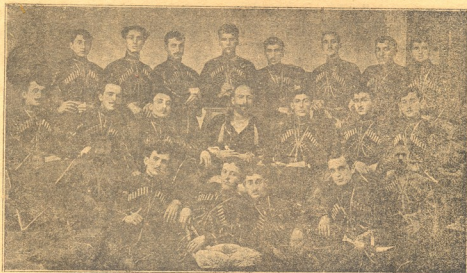
დასავლეთ საქართველოს ხალხური გუნდი ძველ დოღუას დოტბარობით.