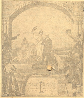
აგაკი—ერის მიერ დადაფნილი (დაიბადა 1840 წ. იენისის მ, გარდ. 1915 წ. იანვ. 28). ჩემი ხატია სამშობლო, სახატე—მთელი ქვეყანა.

№ 24 – 1917 შახი წელიწადი-ჩიხუთი ქვირა თიხათვის 11 20 კ. გაგოცეფისა