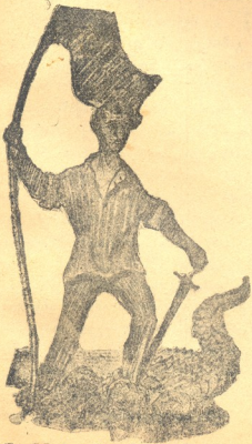
გერთობის მებროსე (ფანქრით წახატი ლ. გულოშვილისა)