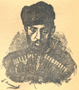
მუშა პოეტი გარდგვალებიდან 80 წ. შესრულების გამო რომ დავაზრო შე ოხერო ღარიბების ბელის წყარო? ამოღულდი, რომ ქვეყანა ერთხერად გააზროს.