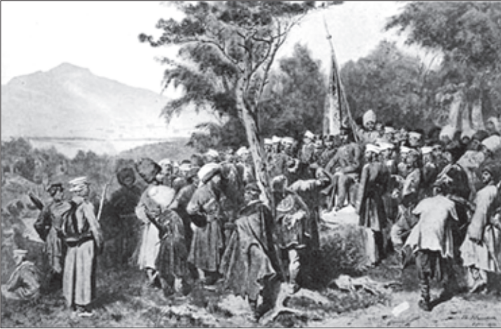
შამილის ტყვედ ჩაპარდნა

ვედრას. იმამმა აქ მიიღო ყველა სტუმარი და შემოიარა კალუგის უფროსები, მაგრამ დროთა განმავლობაში სალამოებს უფრო ხშირად შინ მარტოობაში ატარებდა. დღითიღე მას უფრო და უფრო ენატრებოდა თავისი ოჯახი. ბოლოს და ბოლოს დადგა დღე შამილის ნათესავებთან შეხვედრისა. მისი ოჯახი კალუგაში ჩამოსვლისას 22 სულისაგან შედგებოდა, მათ შორის იყვნენ მოსამსახურეებიც. მალე შამილი ოჯახთან ერთად კიევში გადასახლდა, ხოლო 1870 წელს მას უფლება მიეცა, მექაში გამგზავრებულიყო.