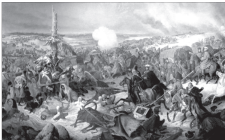
ერთ-ერთი ბრძოლის ეპიზოდი

რეში და ფონს აღარ ეძებდნენ. მაგრამ რაკი ხშირი წვიმების გამო მდინარე ადიდებული იყო, ისინი ხშირ შემთხვევაში იხრჩობოდნენ. ამ ბრძოლაში მთიელებმა დაკარგეს 325 კაცი, რუსებს მხოლოდ 11 ადამიანი მოუკლეს და დაუჭრეს. ჯარების ზემდეგი ვ. ი. ეფრემოვი გამოჩენილი სიმამაცისთვის დააჯილდოვეს წმ. ანას მესამე კლასის კავალერიის ჯვრით.