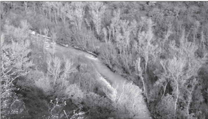
მდინარე ივრის ხეობა

მანსურის მეთაურობით გაჩაღებულმა მოძრაობამ საფრთხე შეუქმნა რუსეთის გეგმებს ამიერკავკასიაში. ამ გარემოებამ უარყოფითი გავლენა იქონია საქართველოს მდგომარეობაზე. ოსმალეთის აგენტმა ომარ-ხანმა საქართველოში დიდი ლაშქრობისათვის უაღრესად ხელსაყრელი დრო შეარჩია; შეიხ მანსურმა წინა კავკასიაში რუსთა ჯარების დიდი ნაწილი ბრძოლაში ჩაითრია, ხოლო რუსეთ-საქართველოსადმი მტრულად განწყობილი პოლიტიკური ერთეულები, ოსმალეთის სახსრებით თუ სხვა დაპირებებით გამხნევებულები, იარაღს ისხამდნენ. 1785 წ. დაღესტნელები ახალციხის ფაშას სწერდნენ, რომ მალე ომარ-ხანი დიდძალი ჯარით საქართველოს შეესეოდა, მაგრამ ფაშა მის მხარეზე თითქოს აშკარად გამოსვლას ვერ ბედავდა, რადგან ეშინოდა, რომ ერეკლე გამარჯვე-