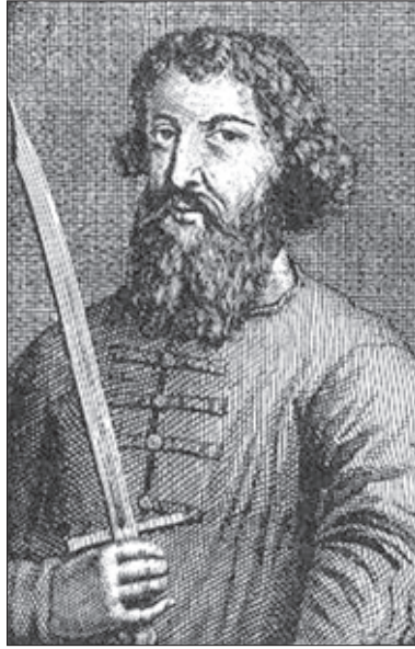
არჩილ II (1647-1713)