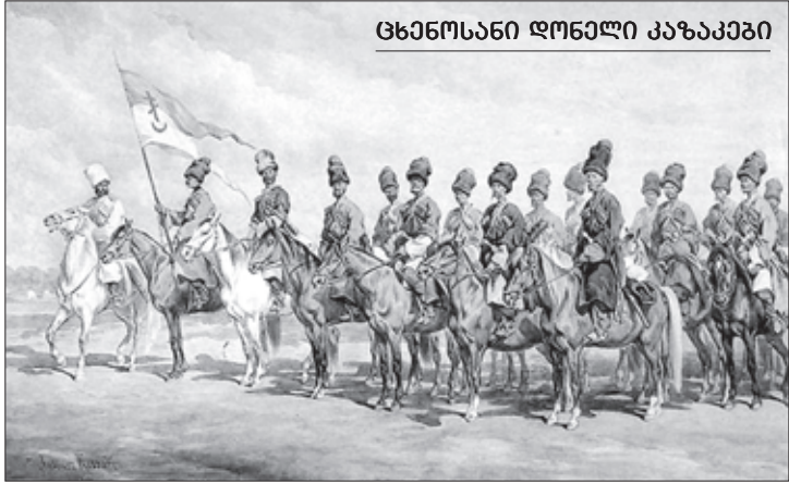
ცხენოსანი ღონელი კაზაკები

ქართველოს სამხედრო გზაზე ძარცვავდნენ მგზავრებს“. ქართველ უფლისწულთა მიერ ნაქეზებულნი (რომლებიც იმერეთში იმყოფებოდნენ) დარწმუნებული იყვნენ, რომ რუსული ჯარები, რომლებიც ამჟამად საქართველოში იდგა, მალე დაუბრუნდებოდა კავკასიის ხაზს. ეს თავდასხმები რომ აღეკვეთა, გენერალმა ი. პ. ლაზარევმა ითხოვა მათ წინააღმდეგ ძალის გამოყენება.