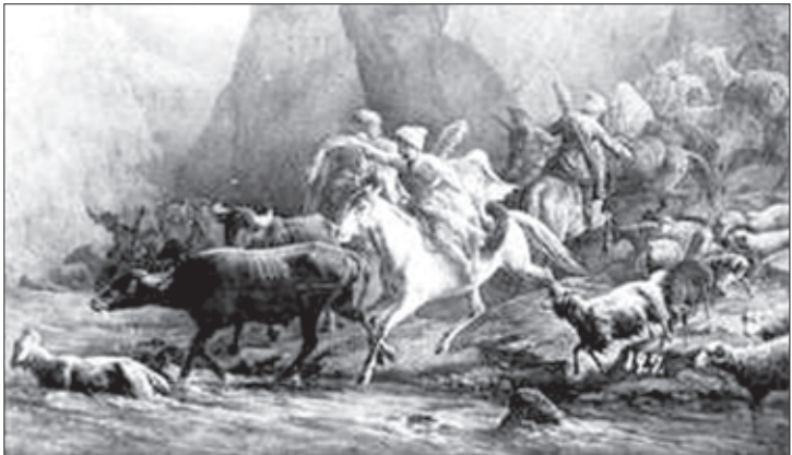
ლეკები ნადავლით ტოვებან სოფელს

შაჰ-აბასის შემოსევების შემდეგ, კახეთის აოხრებით და-