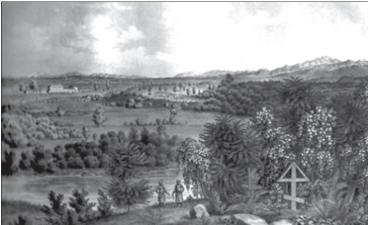
ოზურბეთი, 1830 წ. დიუბუას ნახატი

ამასთანავე უნდა აღინიშნოს ის ფაქტიც, რომ ამ ოქმებიდან მტკიცდება, თუ რა სასტიკი იყო ხალხის განა-