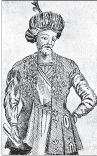
ქართლის მეფე როსტომი (სოსრო მირზა) კრისტოფელ კასტელის ნახატი

XVII საუკუნის პირველ ნახევარში ჩაეყარა საფუძველი საქართველოსთვის ერთ დიდ განსაცდელსაც; სპარსეთისა და ოსმალეთის ხელშეწყობით ქართულ მიწაზე შემოიხაზა მომავალი კონტურები ახალი პოლიტიკური ერთეულებისა — ე.წ. უბატონო, ლეკური თემების. კერძოდ, ჭარბელაქნისა და ელისუს სასულთნოს სახით. აღნიშნული ერთეულები საბოლოოდ XVII-XVIII სს. მიჯნაზე ჩამოყალიბდა. ისინი