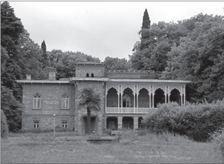
ჭავჭავაძეთა სასახლე წინანდალში

უცებ ვილაცამ ხელზე ძლიერ მომქაჩა. კნეინას მიტოვება არ მენადა, მაგრამ ტყვე ქალს ხომ არ შემეძლო, ჩემს ნებაზე ვყოფილიყავი და მაშინვე საკუთარ ადგილს მივაშურე. ამის შემდეგ ჩემ თვალწინ დატრიალდა სისხლიანი ტრაგედია, რამაც მთელი სხეული ამითრთოლა: კნეინას ახლოს გაიმართა საშინელი შეტაკება. თუმცა ქალბატონი ოდნავადაც არ შერხეულა, რათა მოსალოდნელი საფრთხე აეცილებინა. შეტაკება კი მისი მითვისების მიზნით მოხდა. მტაცებელთაგან ბევრი ხვდებოდა, რომ კნეინა ძვირფასი ნადავლი უნდა ყოფილიყო და მის გამო ერთი მეორეს გააფთრებით უტყვევდა. ბოლოს და ბოლოს ჩხუბი დასრულდა და კნეინა, ჩემს მსგავსად, ერთ-ერთ მეპატრონეს მიეკუთვნა, რომელიც დაიხარა და ჰკითხა: