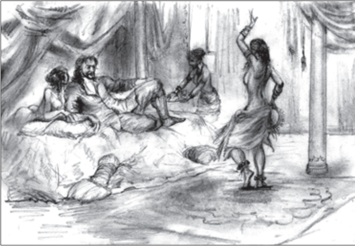
„ჰარეში“ — ნ. კიკელიძის ნახატი

ვი მკითხველი გაიჩინა, ალბათ, იმიტომ, რომ ყველა აღუწერელი ამბავი სინამდვილეა და ჰარამხანის საიდუმლოებას ეხება, ავტორმა თავისი ვინაობა დაუმალა საზოგადოებას, რათა საკუთარი თავიცა და სხვებიც ხიფათისაგან გადაერჩინა. ეგებ ქალების სახელები და გვარებიც გამოგონილი იყოს სხვადასხვა მოსაზრების გამო. მაგრამ ერთი რამ ცხადია, აქ მოთხრობილი ამბავი ჭეშმარიტებაა. ჰარამ არაბულად ნიშნავს ხელშეუხებელს, წმინდას. ჰარამხანა მაჰმადიანების სახლის იმ ნაწილს ეწოდება, სადაც მამაკაცებისაგან განცალკევებით ცხოვრობენ ქალები. მუსლიმანების შეხედულებით, ხელისუფლების არც ერთ წარმომადგენელს, სასულიერო პირი იქნება ის თუ საერო, არც გარეშე მამაკაცებს, შინაურებსაც კი, გარდა სახლის პატრონისა და მისი შვილებისა, ნება არ აქვთ, ჰარამხანის ზღურბლს გადააბიჯონ. გამონაკლისი არიან სულთანი და შაჰი. აღმოსავლეთში გავრცელებული თვალსაზრისით, სამეფო ტახტის მფლობელის ჰარამხანაში შესვლა ბედნიერების სანინდარია.