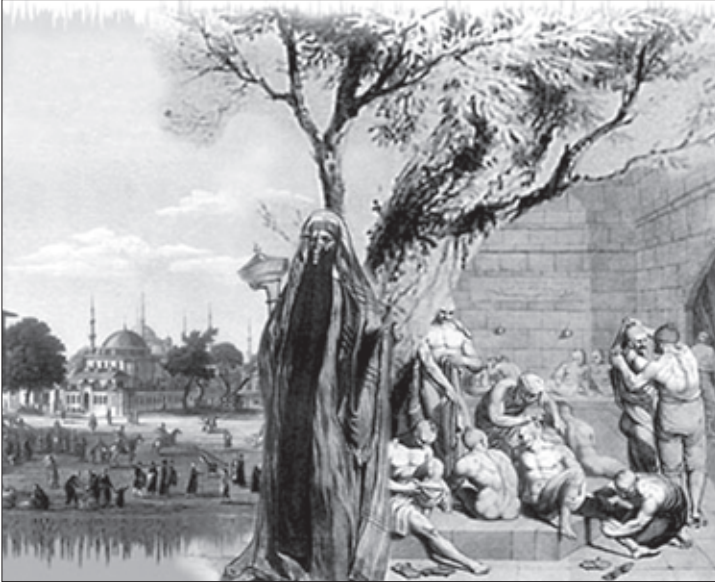
ლევაშოვის თვალით დანახული ისლამური სამყარო

ხელისუფლების მიერ გატარებულ ამ და სხვა ღონისძიებებს უდავოდ ჰქონდა პრევენციული მნიშვნელობა ადამიანებით ვაჭრობისა და სხვა დანაშაულობათა წინააღმდეგ. მაგრამ ამ ეტაპზე მიღწეულად უფრო სამხედრო და ამკრძალავი ღონისძიებების შედეგები ჩაითვლებოდა, ვიდრე ეკონომიკური ზრდა და სოციალური ცვლილებები. ამ დროისათვის შავი ზღვის სანაპირო კარგად იყო დაბლოკილი და დაცული გარეშეებისაგან. რუსეთის საბრძოლო ხომალდები სისტემატურად მიმოდითდნენ ჩრდილო-აღმოსავლეთი სანაპიროს გასწვრივ. სანაპირო სი-