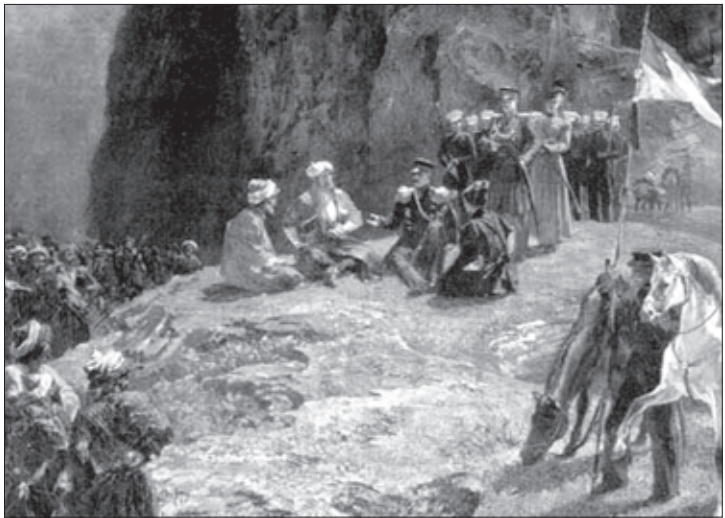
ბანერალ ფონ კლიუგენაუს შესვებრა შაჰილთან, 1837წ., მხატვარი ბრიგოლ გაბარინი

ღრიალითა და ტრიუმფალური შეძახილებით, ლეკები ჩვენი აივნისაკენ მოიწვედნენ და იმდენად მოგვიახლოვდნენ, რომ უკვე მათი ნაბიჯების ხმა გვესმოდა; ამან უკიდურეს სასონარკვეთაში ჩაგვაგდო. ყველამ დავიჩოქეთ,... ლეკებ-