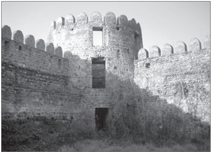
ნურსალ ბეგი გაერთიანებული ჯარით ყვარლის ციხეს შემოადგა

ასეთ ვითარებაში, რასაკვირველია, ყვარლის ციხისთვის ბრძოლამ თეიმურაზ-ერეკლესათვის უდიდესი სტრატეგიული მნიშვნელობა მიიღო, პაპუნას სიტყვით, თუ ისინი ამ ციხეს აიღებდნენ, მაშინ მათ გაღმა-მხარიც დარჩებოდათ, მთელ კახეთსაც ადვილად დაიპყრობდნენ და დასუსტებული ქართლისაკენაც ვერაფრით ვერ შეამარტებდნენ. ამის გამო იყო, რომ თეიმურაზ-ერეკლემ თითქმის ტოტალური მობილიზაცია გამოაცხადეს და ამასთან, სათანადო ჯილდოებიც კი დაანესეს (მათ შორის საკომლო მამულის გაცემა, სათარხნის მიცემა და სხვ.). პაპუნა წერს: მეფეებმა „იარალის ამღები აღარავინ დაადო შინა გლეხი, თორემ თავადი და აზნაურთაგანი ვინ დააკლდებოდაო. ერეკლემ თავისი იშვიათი სამხედრო მოხერხებულობით ყვარელთან ბრწყინვალე გამარჯვებას მიაღწია და ამით ნურსალბეგს ხელი ააღებინა თავდაპირველ განზრახვაზე. ყვარლის ციხის ბრძოლა, თავისი მნიშვნელობის გამო, „ასნლიანი ლეკური ომის“ პირობებში, თამამად შეიძლება მივიჩნიოთ ერთგვარ მარტყოფად თუ ბახტრიონად.