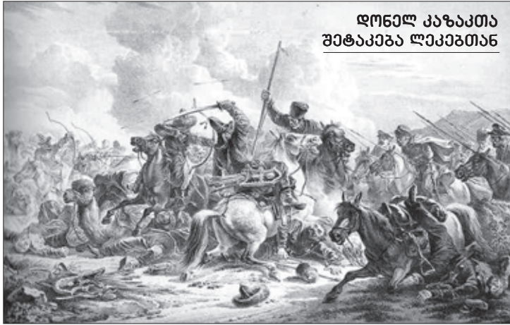
დონელ კაზაკთა შეტაკება ლეკებთან

ზე. პავლე პირველისადმი მიმართვაში ის მეფედ დატოვებას ითხოვდა და იღებდა ვალდებულებას, რომ ის და მისი მემკვიდრენი მართავდნენ ქვეყანას „იმ კანონებით, რომლებიც მისი უმაღლესობის გადაწყვეტილებით იქნებოდა მიღებული“. საქართველოს ყველა შემოსავალს მეფე გიორგი წარუდგენდა რუსეთს, გადასცემდა მას ოქროსა და ვერცხლის ყველა საბადოს. ერთადერთი, რასაც ითხოვდა გიორგი XII, იყო საქართველოს შინაური მტრებისაგან დასაცავად 6 ათასი რუსი ჯარისკაცის გამოგზავნა საქართველოში.