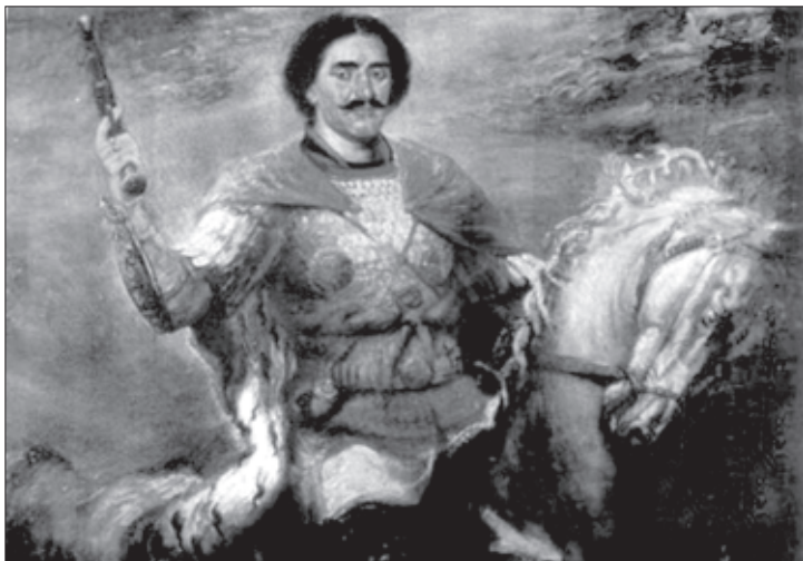
სოლომონ I, ივერთა მეფე

ძნელია აღწერა ლეკთა ყველა იმ თავდასხმისა, რომ-ლებსაც ადგილი ჰქონდა საქართველოში XVIII ს. 50-60-იან წლებში; ეს თავდასხმები იმდენად ინტენსიური იყო, რომ თითქმის გაბმული ბატონობა „ლეკობა“ დამყარდა, მსგავსად „ოსმალობისა“ და „ყიზილბაშობისა“.