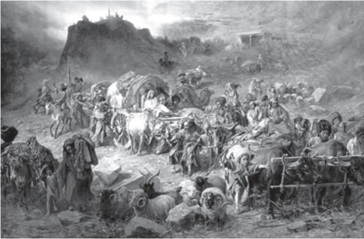
პეტრე ნიკოლოზის კი გრუზინსკი — „მთიელეზი აულს ტოვებენ“

მარეობა მოუპოვა ისედაც გავრცელებულ ისლამს. მანსური თავის თავს წინასწარმეტყველად აცხადებდა, შეიხად (მეთაურად) და იმამად (ისლამის რელიგიურ მეთაურად). მალე მის გარშემო 12 ათასამდე მეომარი შეიკრიბა.